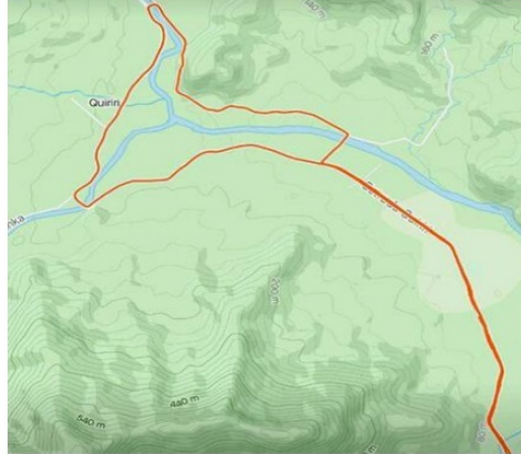
MAPA 12K QUIRIRI