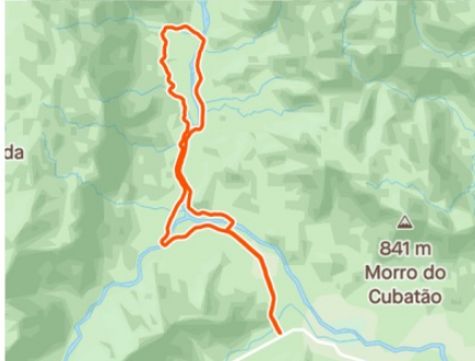
MAPA 21K QUIRIRI